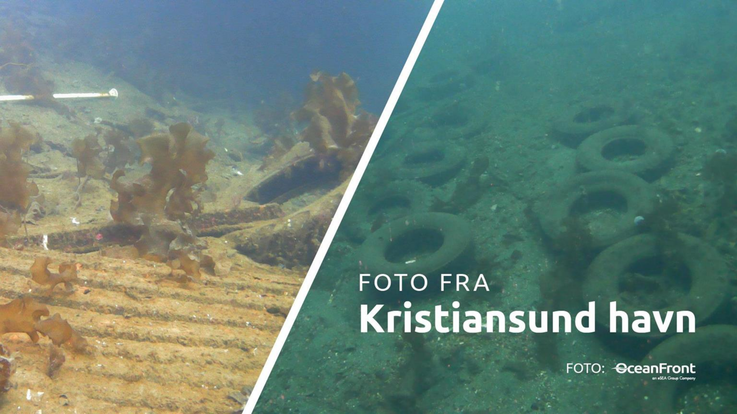
FOTO FRA Kristiansund havn